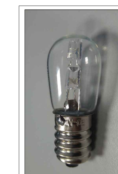
Lampada votiva con sorgente a LED, calotta vitrea e fotosensore