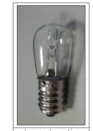
Lampada votiva con sorgente a LED, calotta vitrea e fotosensore