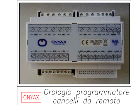
Orologio programmatore cancelli da remoto