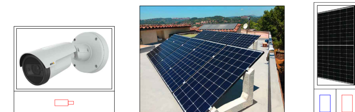
Tipico installativo, struttura a 30°, su tetto piano