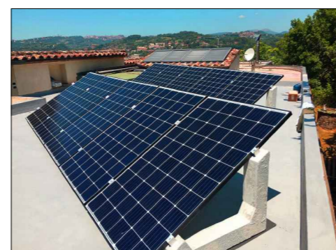
Tipico installativo, struttura a 30°, su tetto piano