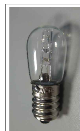
Lampada votiva con sorgente a LED, calotta vitrea e fotosensore